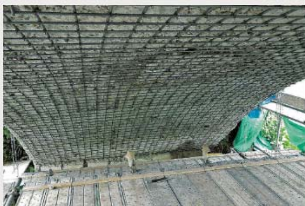
▲①リフレドライショット工法での吹付け